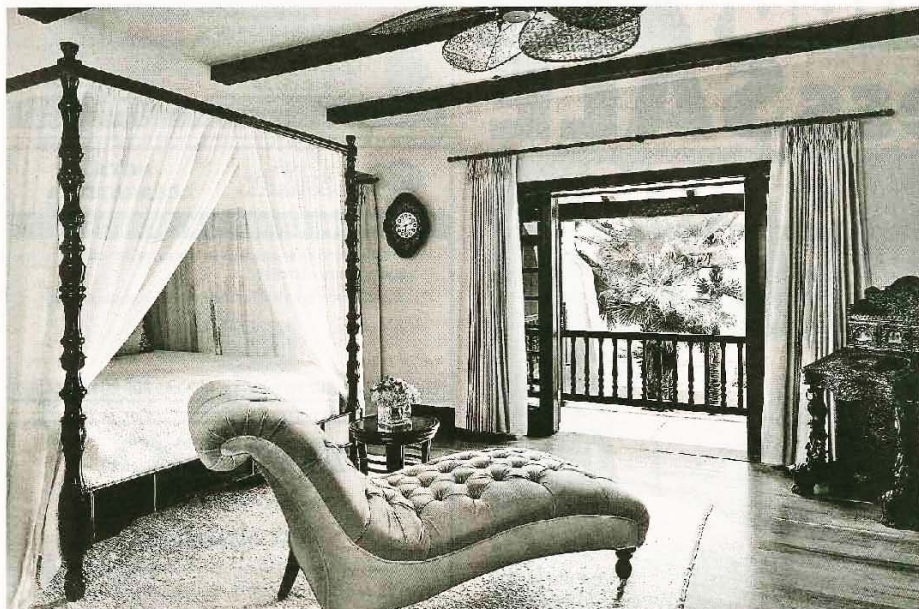
EL COSTO promedio de habitación por noche comienza entre los $1,200 y $1,600.

Helbling no duda de que, con este crecimiento y el servicio entusiasta de los empleados —que en un 98% son puertorriqueños—, el nuevo hotel logre rápidamente un lugar privilegiado entre los destinos que se consideran high-end .