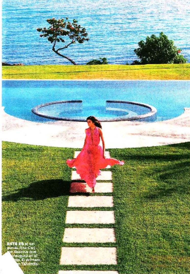
ESTE ES EL segundo Ritz-Carlton Reserve que inaugura el mundo. El primero en Tailandia.